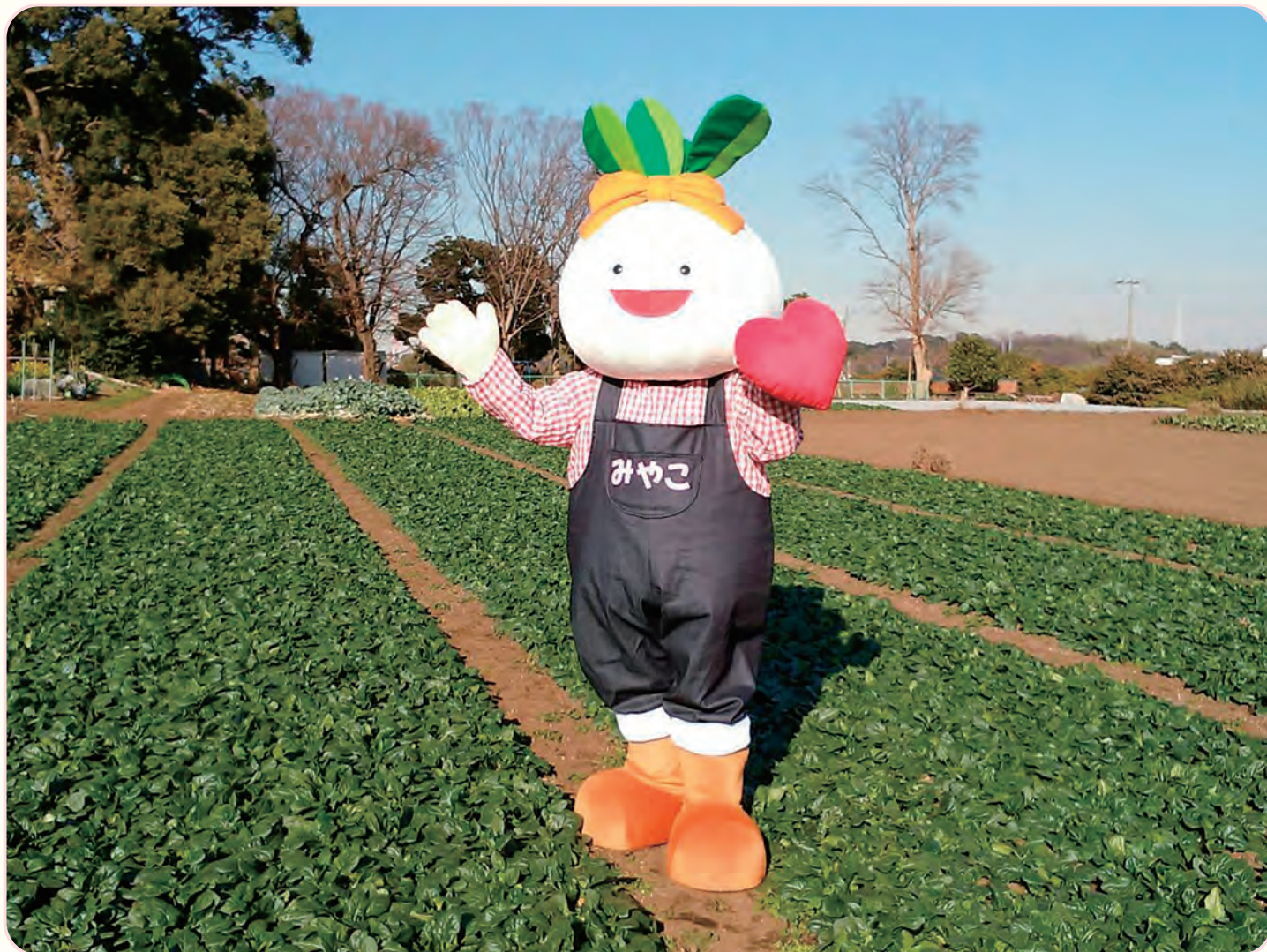
都田地区地域福祉保健計画キャラクター 小松菜hairのみやこちゃん