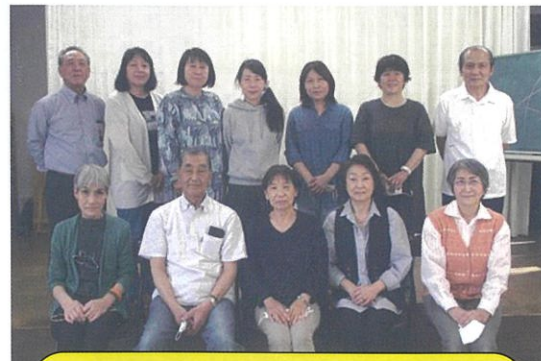
民生児童委員は、地域の皆様の身近な相談員です。生活していく中で悩み事・コロナ禍での困り事等がありましたら是非相談してください。