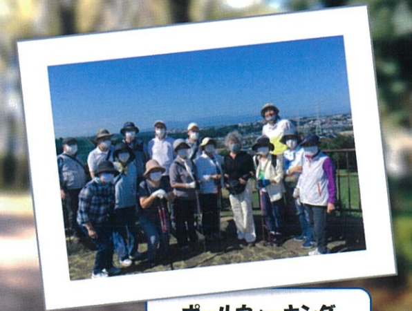
ポールウォーキング (川和富士)