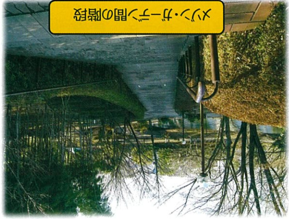
ミン・ガーデン間の階段