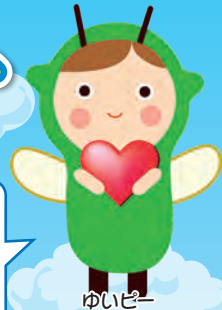
ゆいぴー ※都筑区社会福祉協議会の マスコットキャラクター

新型コロナウイルスの影響でマスク等の入手困難な状況が続きましたが、やっと手に入った不織布マスクや手作りマスク、消毒液、なかには食料品を寄付して下さった方もいらっしゃいました。お預かりした寄付金品は、区内の福祉施設やボランティア団体などに配分しています!