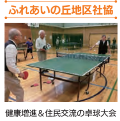
ふれあいの丘地区社協