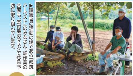
▶障害者の活動の場である「都筑ハルソラ」のみなさん。畑作業の間も高圧洗浄機で感染予防に取り組んでいます。