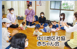
中川地区社協 赤ちゃん会