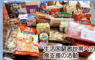
生活困窮者世帯への食支援の活動