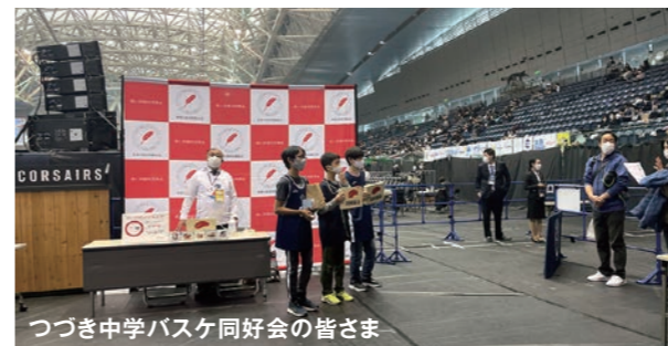
つつき中学バスケ同好会の皆さま