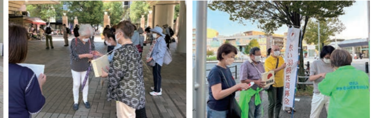
共同募金が財源の「ふれあい助成金」を受けているボランティア団体の皆さま