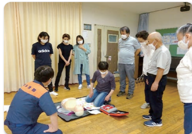
心肺蘇生とAEDの実施訓練の様子

地区社協初の救急救命講習を中川西地区センターで行いました。総勢19名の地域住民が参加し、消防士の方の指導の下、心臓蘇生とAEDの使い方等を学び、救命処置に必要な知識・技術を習得しました。消防士さんがとても頼もしく尊敬を感じるとともに、ボランティア活動をしている参加者にとり、重要で貴重な体験となりました。今後もこうした生きた活動を続けていきたいと思ひます。