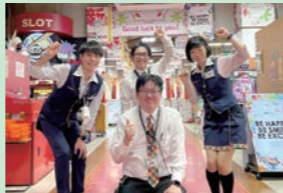
ドキわくランド北山田店 一同

約1年が経ち、お客様からも自然とお菓子の寄付BOXに入れて頂く事が増えました。今後もこのような取組を積極的に進め、地域に貢献していきたいと考えております。今後とも宜しくお願い致します。