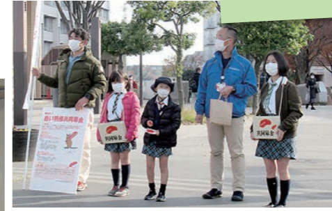
ガールスカウト 神奈川県第41団さんにもご協力いただきました