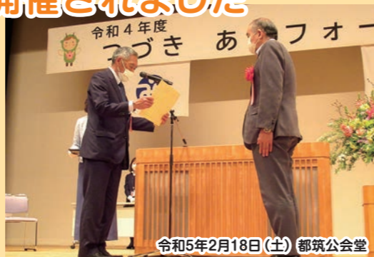
令和5年2月18日(土) 都筑公会堂