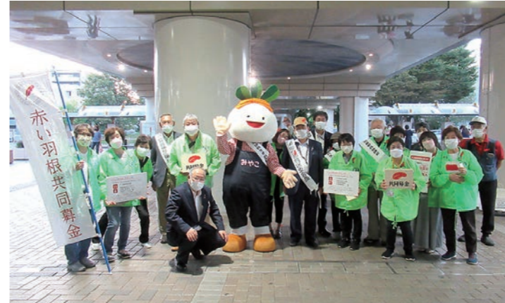
10月1日 民生委員児童委員による街頭募金運動