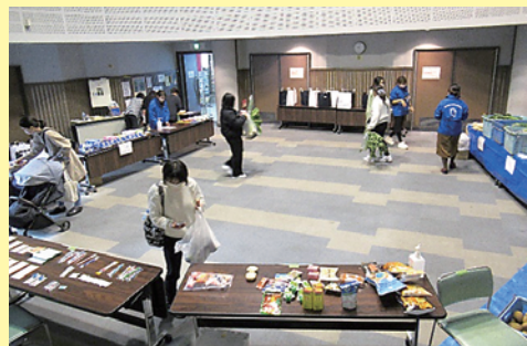
子どものいる困窮世帯を対象とした「食のお渡し会」の様子