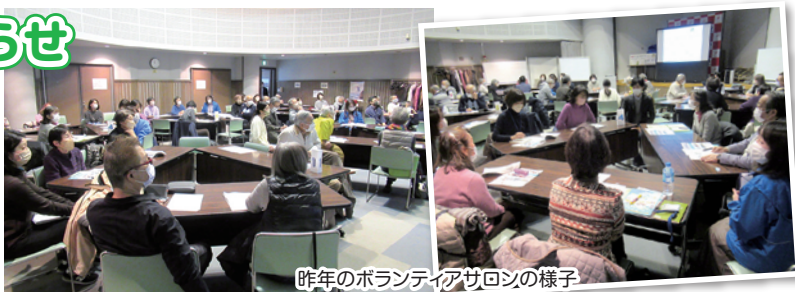
昨年のボランティアサロンの様子

区内4カ所のボランティア団体をお呼びして、活動内容の紹介をしていただきます。ボランティアとして活動されている方も興味のある方も、気軽にお話しできるサロンとなっています。