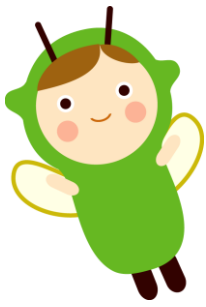
都筑区社協キャラクター ゆいピー