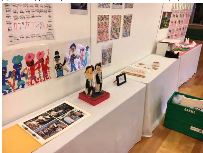
過去の展示（ハートフルガーデン川和）